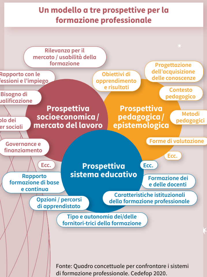
Fonte: Quadro concettuale per confrontare i sistemi di formazione professionale. Cedefop 2020.

3. Comparazioni basate su tipologie Una comparazione basata su una tipologia privilegia un numero limitato di criteri di confronto. Attualmente, tra quelli più noti, figura quella proposta da Wolfgang Greinert. Quest'ultimo opera una distinzione tra i Paesi con una governance «statale» come la Francia, «liberale» come l'Inghilterra o «cooperativa» come la Germania. In un'ottica analoga, Marius Busemeyer e Christine Trampusch propongono una tipologia basata su due criteri di confronto, ossia «il coinvolgimento delle imprese» e «l'impegno dello Stato». Questa tipologia permette soprattutto di distinguere il modello francese, con un forte coinvolgimento dello Stato e uno scarso coinvolgimento delle imprese, il modello americano, con uno scarso coinvolgimento dello Stato e delle imprese, nonché il modello svizzero e tedesco, con un forte coinvolgimento sia dallo Stato sia delle imprese. Queste tipologie rappresentano degli strumenti utili per mettere in risalto dei punti salienti di questo o quel sistema. Tuttavia, la scelta limitata di criteri ne riduce la portata e rischia di condurre a semplificazioni incapaci di riflettere sia le eventuali differenze tra i Paesi appartenenti ad uno stesso tipo, sia le differenze che possono esistere all'interno dei Paesi stessi.